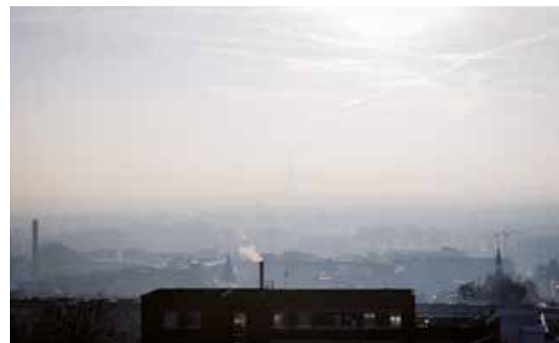
Les particules fines, l'ozone et les oxydes d'azote sont les principales composantes du « smog », brume plus ou moins dense dans les zones urbaines.

Lors des pics de pollution, la population est très attentive à la qualité de l'air, mais il faut retenir que c'est la pollution régulière et sur une longue durée , même à des niveaux de pollution modérés, qui a le plus d'effets sur la santé.