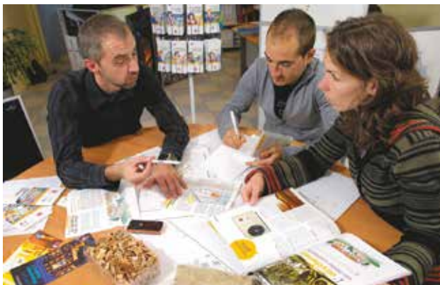
Les conseillers des Points rénovation info service vous reçoivent pour vous aider à monter votre projet de rénovation.

rejets domestiques de polluants ; • informe, accompagne et conseille les particuliers dans leur choix de systèmes de chauffage performants et peu polluants ; • encourage le renouvellement des appareils de chauffage au bois non performants.