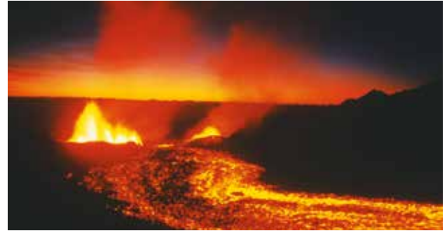
Des gaz et des particules sont émis lors d'éruptions volcaniques. Éruption du Piton de la Fournaise à la Réunion en 2009.