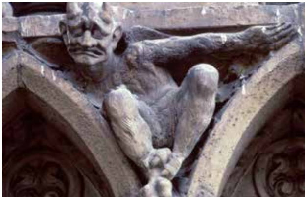
Le patrimoine bâti peut être dégradé par la pollution atmosphérique.

La pollution de l'air salit et dégrade les matériaux et les bâtiments : formation de croûtes noires sur les façades, dissolution des pierres, notamment calcaires, sous l'effet des pluies acides... Les atteintes au patrimoine bâti sont parfois irréversibles et de coûteux travaux de ravalement et de rénovation sont nécessaires.