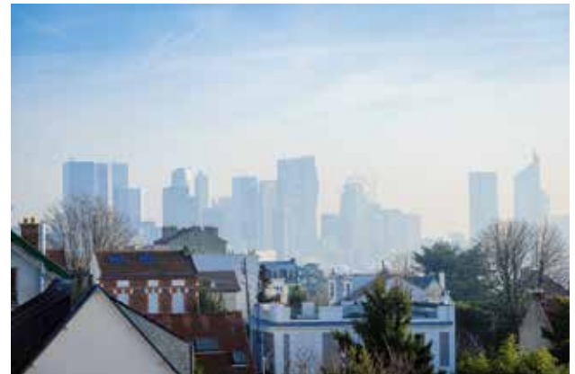
Concentration urbaine, période de chauffage, trafic routier dense, stabilité des couches d'air, ensoleillement: la conjugaison de ces conditions favorise l'apparition de pics de pollution.

Les polluants dans l'air extérieur peuvent affecter des zones éloignées de plusieurs centaines de kilomètres des lieux d'émissions. Ils génèrent alors des phénomènes de très grande ampleur comme les pluies acides ou l'eutrophisation et par des dommages sur la végétation.