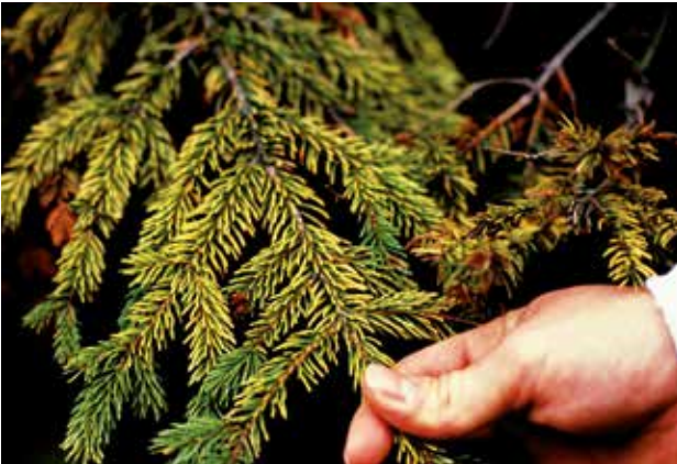
Jaunissement des aiguilles de conifères dû aux pluies acides.

Les dommages visuels dus aux effets à court terme de l'ozone sont aussi une gêne notable sur la valeur marchande des plantes cultivées sensibles à l'ozone.